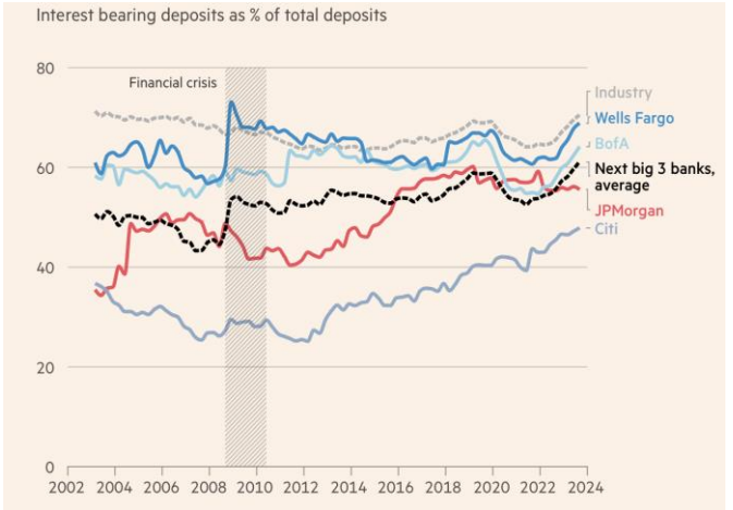
ที่มา: BankRegData, FT

(CIB) ใน 4Q กำไรสุทธิ เท่ากับ $2.5 พันล้าน ลดลง 24% และรายได้รวม เท่ากับ $1.1 หมื่นล้าน เพิ่มขึ้น 3% และกลุ่ม Commercial Banking (CB) ใน 4Q กำไรสุทธิ เท่ากับ $1.7 พันล้าน เพิ่มขึ้น 16% และรายได้รวม เท่ากับ $4.0 พันล้าน เพิ่มขึ้น 18% จากรายได้ดอกเบี้ยสุทธิและค่าธรรมเนียม วาณิชธนกิจที่สูงขึ้น ด้าน Guidance ปี 2024 จากผู้บริหาร คาดว่ารายได้จากดอกเบี้ยสุทธิประมาณ $9 หมื่นล้าน และ NCO rate ของธุรกิจต่ำกว่า 3.5%