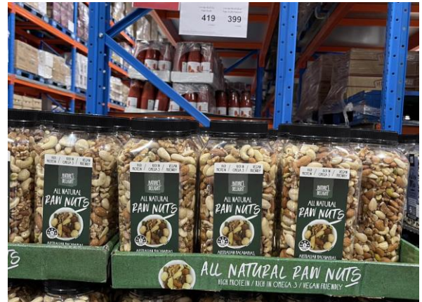
Fig 5: Imported snacks