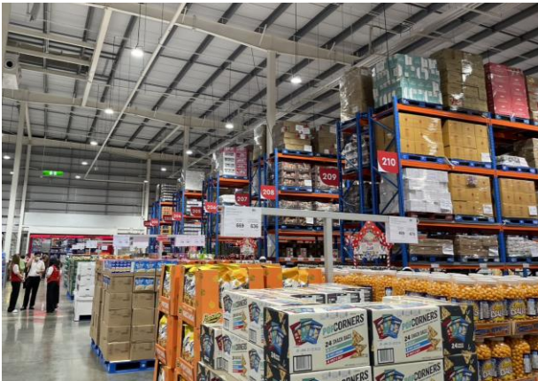
Fig 4: Imported snacks zone (the best selling category)