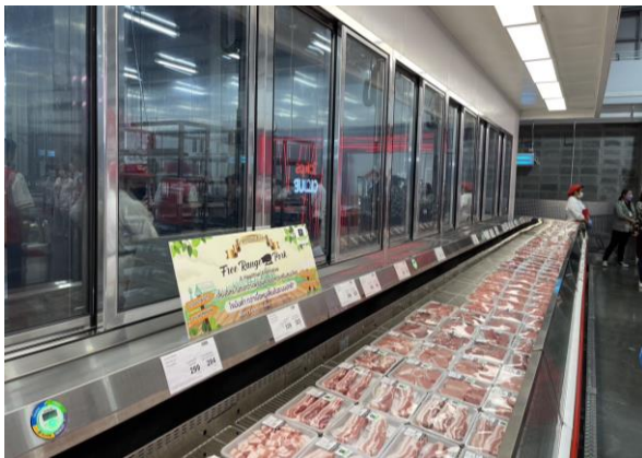
Fig 6: Fresh foods