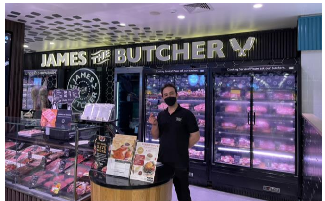
Fig 9: Premium meat selection (Tops food hall)