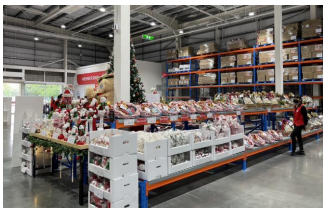
Fig 2: Festive products