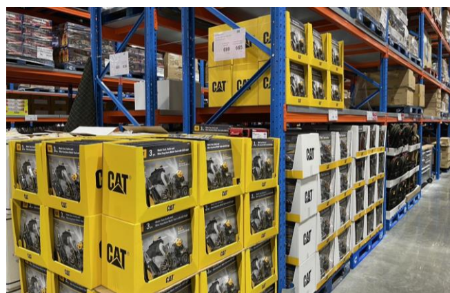
Fig 3: Exclusively imported hardware