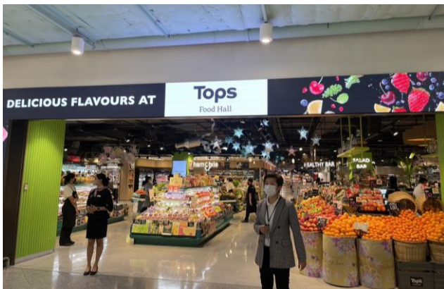
Fig 8: Newly rebranded Tops food hall