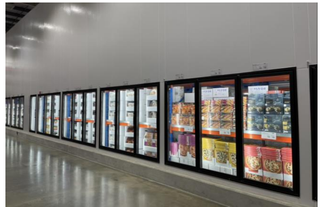
Fig 7: Frozen products